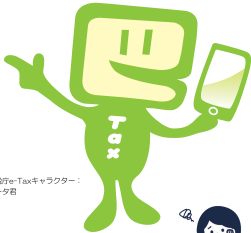
国税庁e-Taxキャラクター：イータ君

国税の場合はe-Tax、地方税の場合はeLTAXを利用して、事前に届出をした預貯金口座からの振替により、簡単な操作で税金を納付することができる便利な電子納税の手段です。